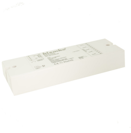
ARTNR 860360 TYPE IZD-RF4X8A36

Elke controller dient gevoed te worden door een externe voeding. Kijk voor het volledige assortiment 12 of 24V voedingen op onze website