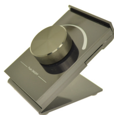
ARTNR 806374 TYPE IZD-RF-DIM-BURO