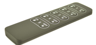
ARTNR 860382 TYPE IZD-RF-DIM5Z-RC