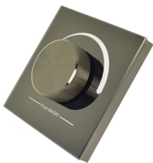
ARTNR 860370 TYPE IZD-RF-DIM-MI