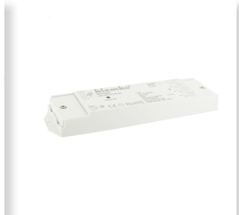
ARTNR 860364 TYPE IZD-RF4X700-36