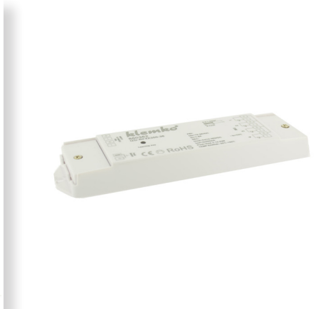
ARTNR 860362 TYPE IZD-RF4X350-36